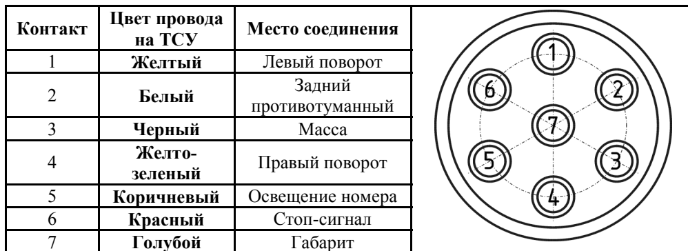
СХЕМА МОНТАЖА ТСУ