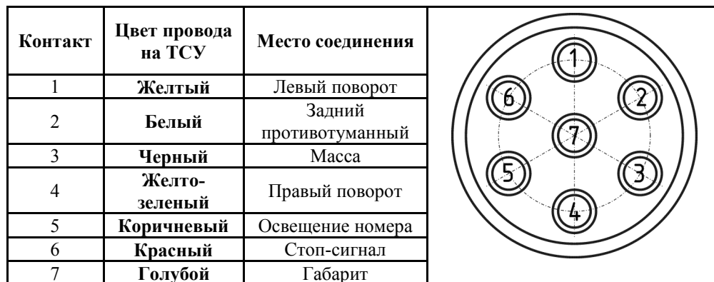
СХЕМА МОНТАЖА ТСУ